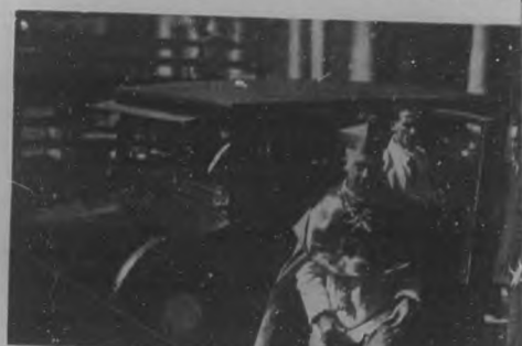
UNA GRAN SOLEMNIDAD RELIGIOSA.—Momentos en que Monseñor Manríquez llegaba a la puerta de la Catedral, para ser consagrado arzobispo de la Habana.