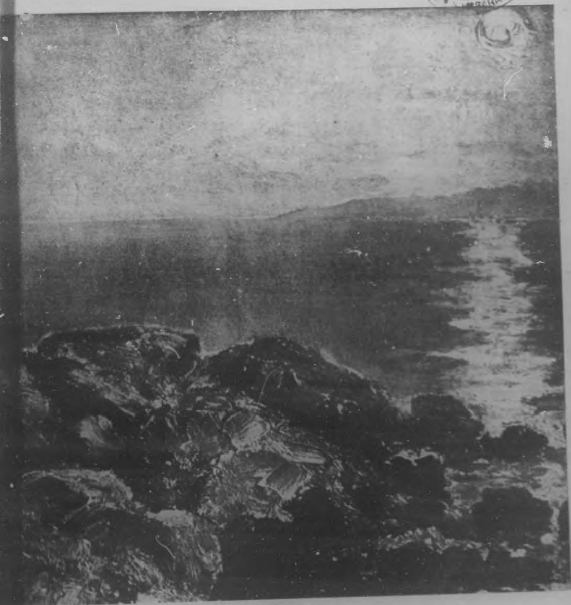
RASTRO DE LUZ Oleo de E. Robert