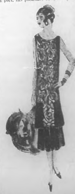
Elegante traje de noche, estampado de metal, con volante plisado.

Si le fuera posible, podría darse masajes generales por profesional y también baños calientes yodado, para que elimine la grasa.