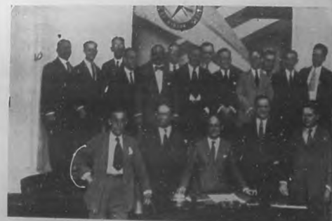
LA SOCIEDAD DE REPORTERS.—Los apreciables compañeros que componen la Directiva de la Asociación de Reporters, en los momentos de tomar posesión de