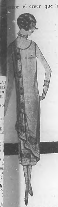
de crepé blanco en cuentas y pedas de distintos colores.

POR ENRIQUETA PLANAS DE MONEDA Calle 15 Núm. 468, entre 10 y 12. Vedado.