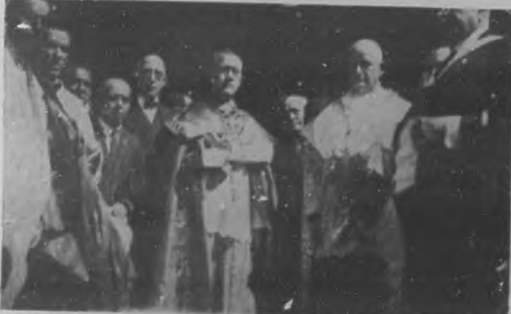
UNA GRAN SOLEMNIDAD RELIGIOSA.—Monseñores Ruiz y Zubizarreta, momentos antes de que empezara el solemne acto en que fueron consagrados arzobispos.