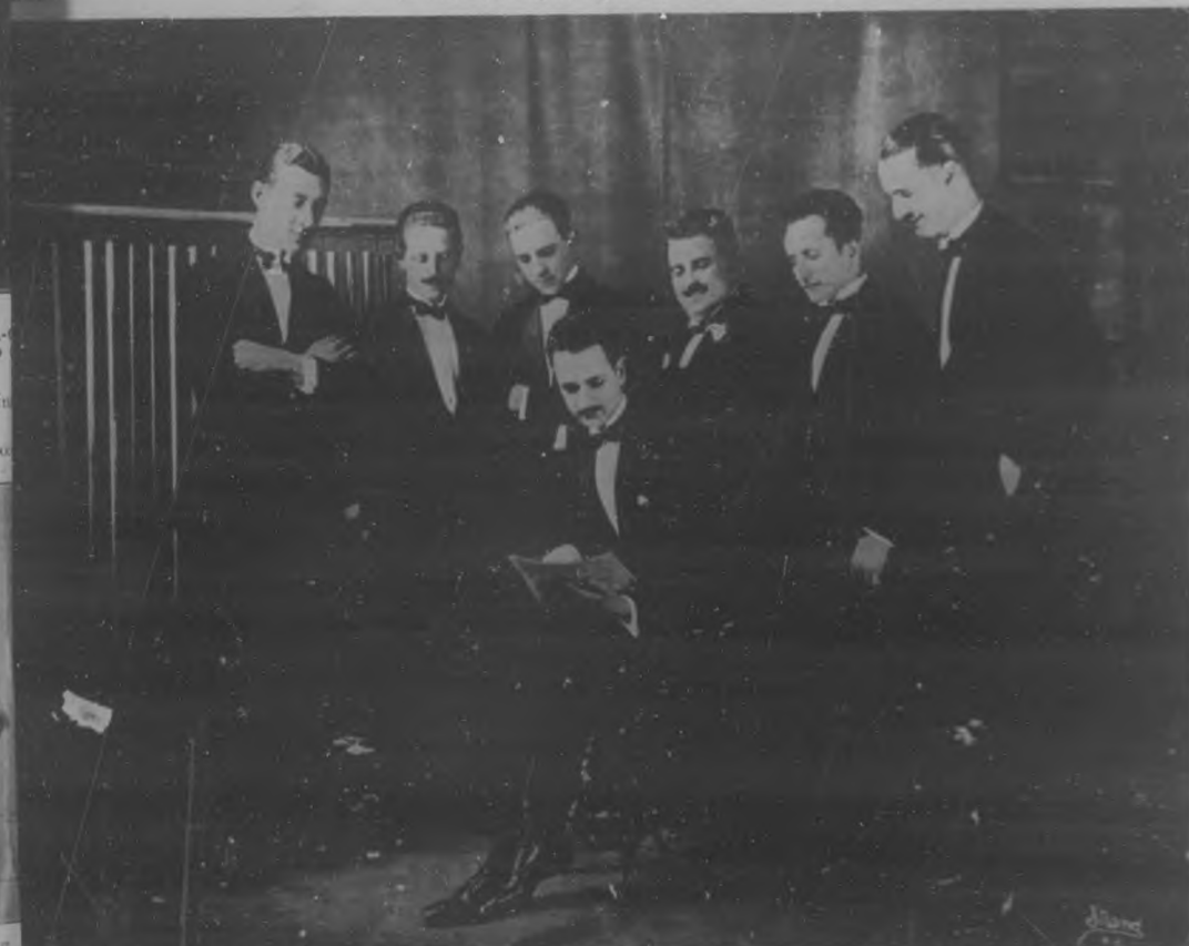
Profesores que componen la magnífica orquesta de la compañía de "New York Follies", que con tanto éxito actúa en el Teatro Cubano.

Uno de los éxitos artísticos del año será el estreno en Cuba de la magnífica película "Sodoma y Gomorra", que nos presenta el Sr. Becali y que se estrenará el día 4 de marzo.